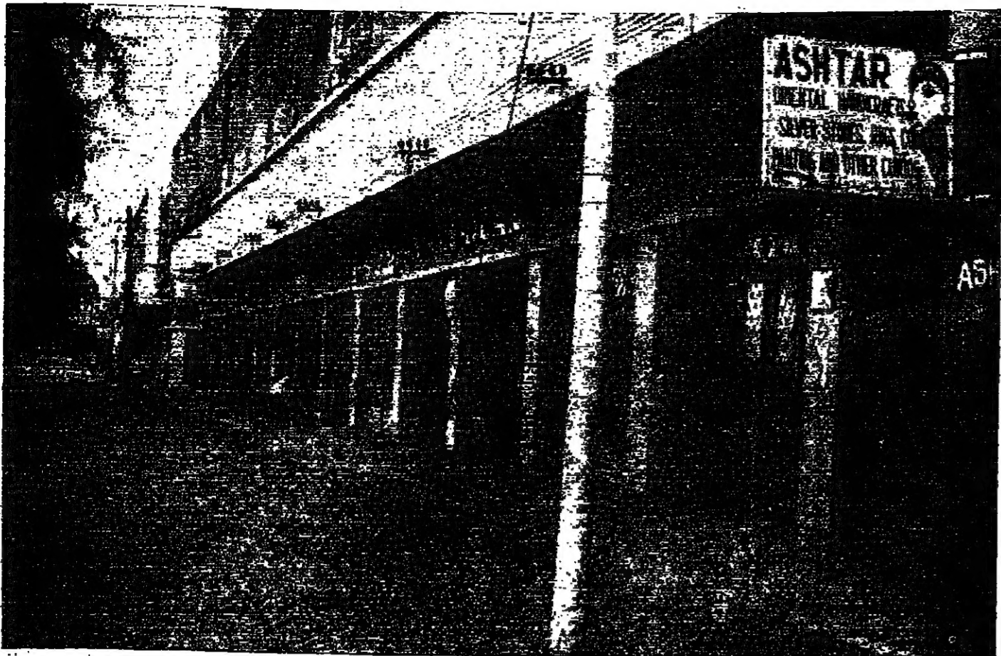
المحلات التجارية مغلقة في شارع رئيسي في بغداد صبيحة يوم الانقلاب العراقي وبسبب منع الجول الذي فرض في ذلك اليوم التصوير اليوناني